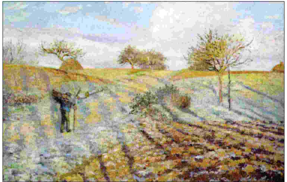
Camille Pissarro, «Gelata bianca» (1873)